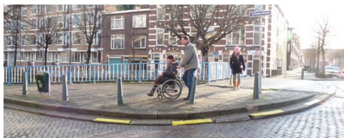
Door de dubbele parkeerband op de hoek kan de rolstoel er niet af