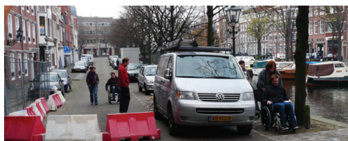
Wegomleiding bij werkzaamheden laat geen ruimte voor rolstoelgebruikers

Ook omleidingroutes bij werkzaamheden worden nog te vaak verkeerd aangelegd en onduidelijk of niet aangegeven. Stadsbeheerders kunnen een belangrijke rol spelen in het verbeteren van de toegankelijkheid door scheve, omhoogkomende, verzakte en kapotte bestrating snel te repareren.