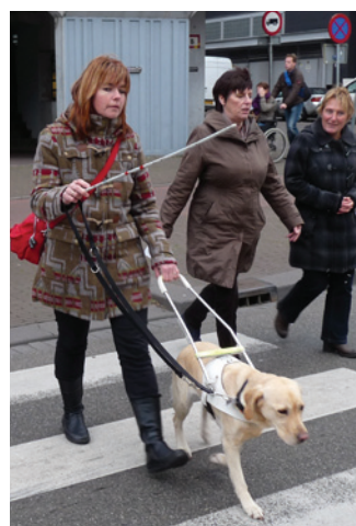
Oversteken bij het zebra-pad

Voor mensen met een visuele beperking is het vaak lastig om zich te oriënteren op straat, zeker op locaties waar hoogteverschillen ontbreken zoals op de kruising Spui en Grote Markt. Naast hoogteverschillen is ook het materiaal van de bestrating belangrijk. Blinden en slechtzienden voelen met hun voeten en taststok als ze op andere bestrating komen. Slechtzienden maken daarnaast ook gebruik van kleurverschillen. Belangrijk is daarom dat er een groot kleurcontrast is tussen weggedeeltes met verschillende functies, bijvoorbeeld tussen een stoep en een fietspad. Ook 'Hagenaartjes' worden veel zichtbaarder met een opvallende kleur. Oversteekplaatsen bij een kruising zijn soms lastig te vinden voor mensen met een visuele beperking. Ook zebra's worden niet altijd herkend, omdat je deze niet kunt voelen. Bovendien vindt een blindengeleidehond een zebra niet als deze niet is doorgetrokken op het fietspad. Het plaatsen van markeringstegels is daarvoor een oplossing. Een test met verschillende vormen van bestrating en materialen vindt binnenkort plaats aan de Plesmanweg.