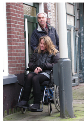
De lantaarnpaal maakt de stoep erg smal